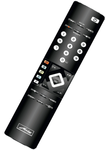
Black with brushed aluminium decorative trim and aluminium surround